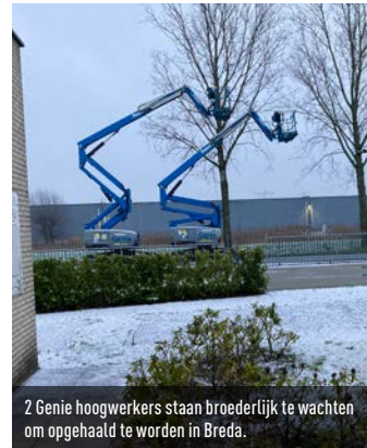
2 Genie hoogwerkers staan broederlijk te wachten om opgehaald te worden in Breda.