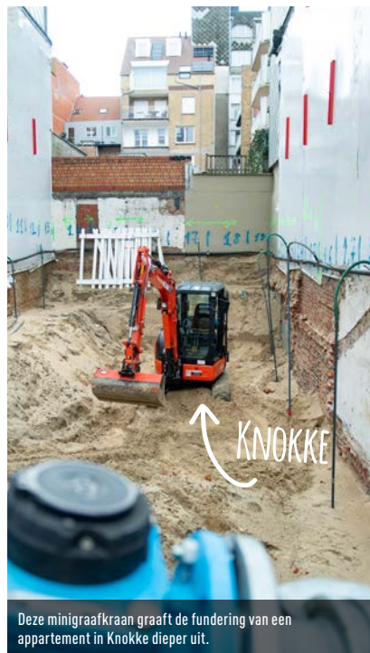
Deze minigraafkraan graaft de fundering van een appartement in Knokke dieper uit.