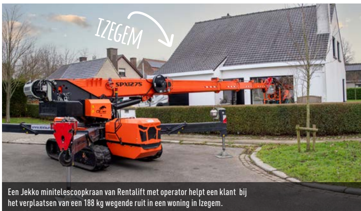
Een Jekko minitelescoopkraan van Rentalift met operator helpt een klant bij het verplaatsen van een 188 kg wegende ruit in een woning in Izegem.