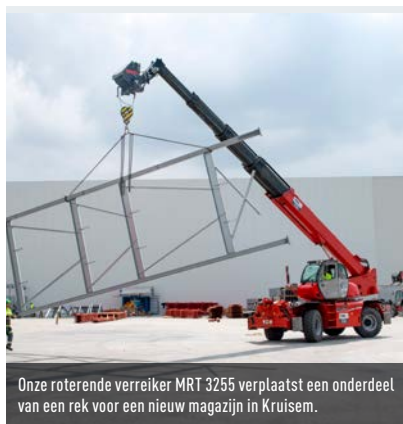
Onze roterende verreiker MRT 3255 verplaatst een onderdeel van een rek voor een nieuw magazijn in Kruisem.