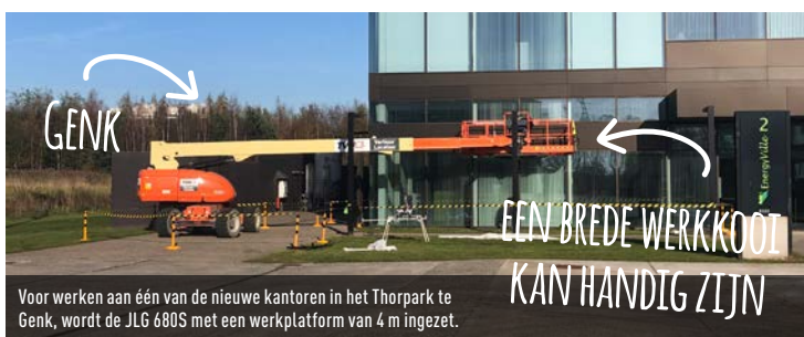
Voor werken aan één van de nieuwe kantoren in het Thorpark te Genk, wordt de JLG 680S met een werkplatform van 4 m ingezet.