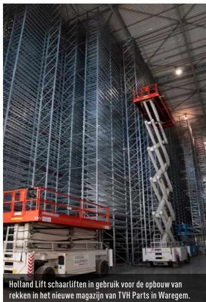
Holland Lift schaarliften in gebruik voor de opbouw van rekken in het nieuwe magazijn van TVH Parts in Waregem.