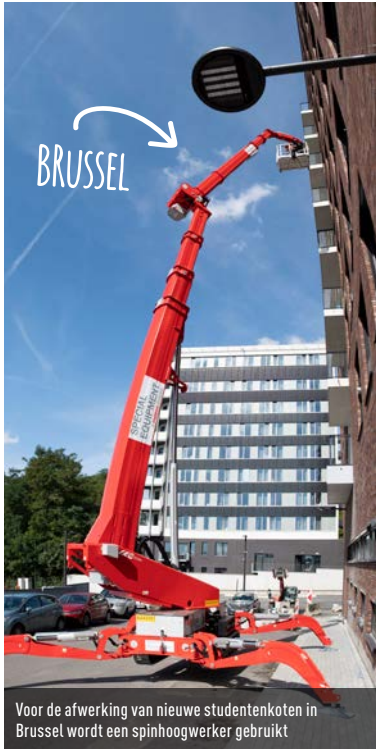
Voor de afwerking van nieuwe studentenkoten in Brussel wordt een spinhoogwerker gebruikt