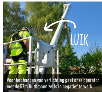
Voor het hangen van verlichting gaat onze operator met de 67m Ruthmann zelfs in negatief te werk