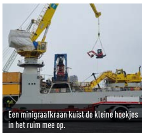
Een minigraafkraan kuisst de kleine hoekjes in het ruim mee op.