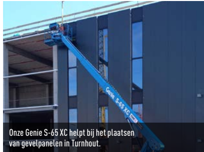
Onze Genie S-65 XC helpt bij het plaatsen van gevelpanelen in Turnhout.